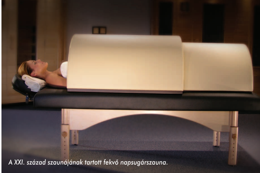
A XXI. század szaunájának tartott fekvő napsugársauna.

Stresszoldás és wellness-érzés kialakulása: Homor Györgyné 28 éves vendége 8 kg súlyfeleslegtől kívánt megszabadulni: „Teljesült a vágyam a fogyást illetően, az 5-ször 40 perc kiegyen-